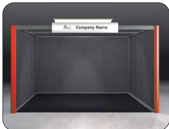
Preallestito standard 400 x 400/350 x 263 h